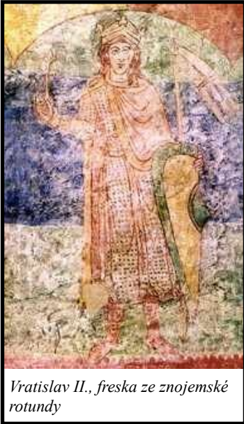
Vratislav II., freska ze znojemské rotundy

Prvním českým králem byl Vratislav II. v letech 1085-1092. Tento Přemyslovec obdržel osobně korunu pro království České a Moravské. Mezi přemyslovci, vítkovci, slavnikovci a dalšími byla tradiční úmluva stanovení mluvčího za každý rod. Z toho důvodu se tato královská koruna nestala dědičnou a koruna propadla nebo byla vrácena císaři německému. Království české se tak opět stalo knížectvím a na královský status muselo čekat až na dvanácté století. Byl to Vladislav I., příslušník přemyslovců, který se narodil 1110 a knížetem se stal v roce 1140. Na svůj věk dosti mladý a tak na královskou korunu musel čekat až do roku 1158.